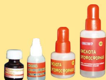
10мл. 15мл. 25мл. 50 мл. 100мл.

10 мл. Стекланная бутылка с основной и контрольной крышкой.