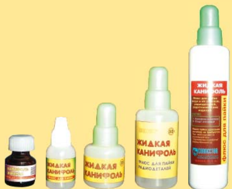
10мл. 15мл. 25мл. 50 мл. 100мл.

10 мл. Стекланная бутылка с основной и контрольной крышкой.