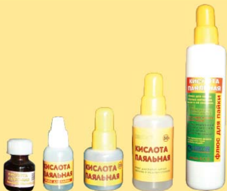
10мл. 15мл. 25мл. 50 мл. 100мл.

10 мл. Стекланная бутылка с основной и контрольной крышкой.